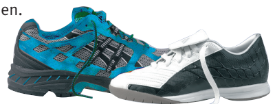
Joggingschuh / Universal-Hallen-Sportschuh

Man sollte sich beim Kauf also gut beraten lassen und die Möglichkeit nutzen, qualitativ hochwertige Auslaufmodelle preisgünstig zu erwerben.