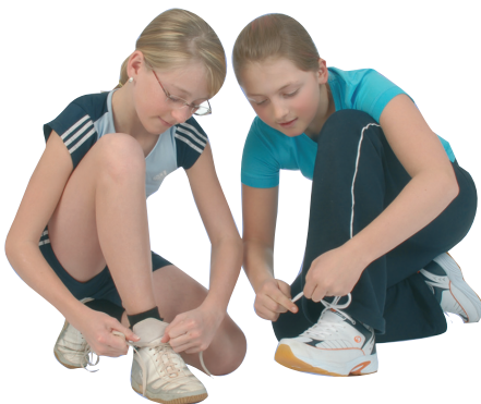
Ideal für den Sportunterricht: Universal-Hallen-Sportschuh (Schulsportschuh)

Sportschuhe, die man im Sportunterricht in der Halle trägt, sollen nicht auf der Straße getragen werden. Sie bringen sonst Schmutz in die Sporthalle, erhöhen dadurch das Unfallrisiko (Rutschgefahr) und die Gefahr der Verbreitung von Krankheitserregern. Wird der Hallensportschuh im Freien benützt, ist vor der weiteren Nutzung in der Sporthalle eine gründliche Reinigung des Schuhs erforderlich.